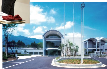
富士山合宿場 3号館