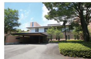
富士山合宿場 1号館

英語 英単語・イディオム・重要構文の最終確認とともに、長文に対するアプローチを徹底。