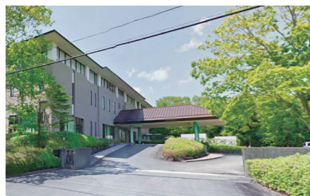
富士山合宿場 2号館